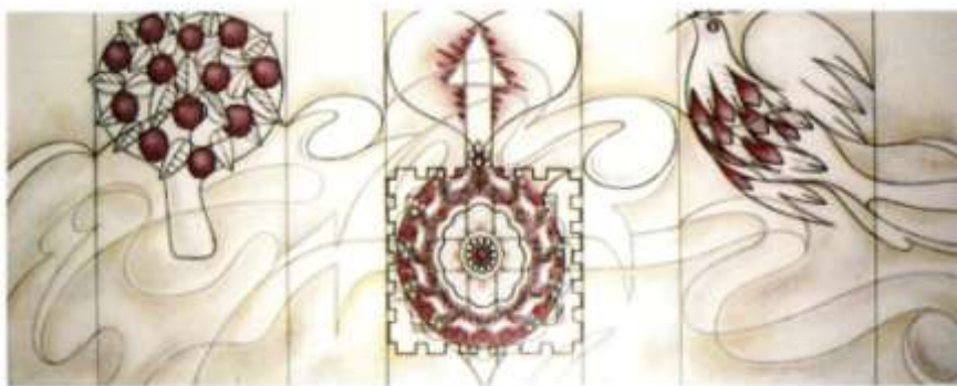
De 3 Drieluiken, gemaakt door Frits Frietman. (link)

Inmiddels was hervormd en gereformeerd Voorburg 'Protestantse Gemeente Voorburg' geworden. Omdat het ledental bleef teruglopen moest er in 2013 weer een kerk sluiten, de gereformeerde Fonteinkerk en twee jaar later de hervormde Opstandingskerk.